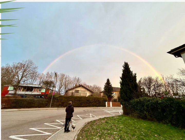
Regenbogen im Dezember von Annette Fiedler