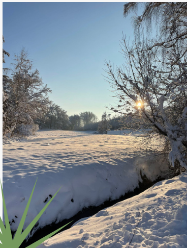
Winterlandschaft von Bernhard Räßle