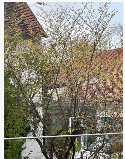
Blühende Hamamelis von Birte Nedelcev