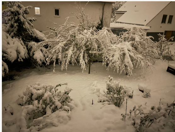
Nächtlicher Schnee von Birte Nedelcev